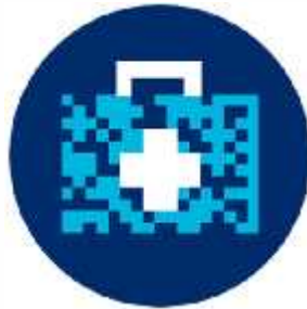
بهداشت و درمان