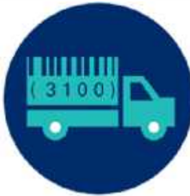
حمل و نقل و لجستیک