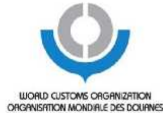
سازمان جهانی گمرک WCO