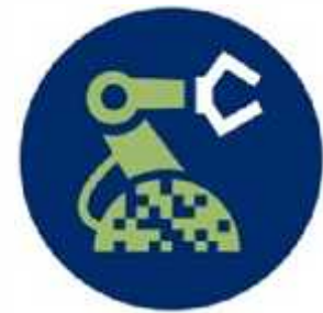
صنایع فنی و تکنیکال