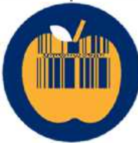
مواد غذایی تازه