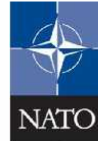
سازمان پیمان آتلانتیک شمالی NATO