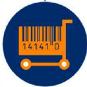
کالاهای بسته بندی شده سوپر مارکتی